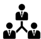
Samenwerken en innoveren