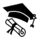
Stage & Afstuderen